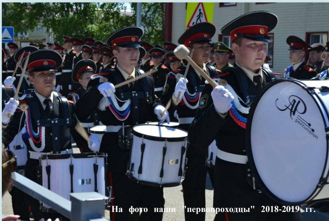
На фото наши "первопроходцы" 2018-2019 гг.

7 сентября отмечается праздник барабанщиков.